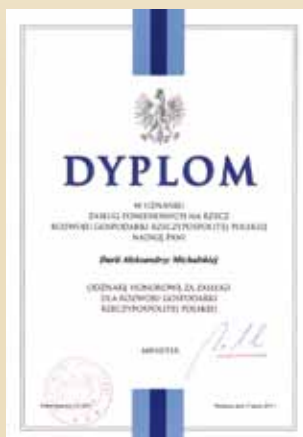
Odnaka honorowa za zasługi dla rozwoju gospodarki Rzeczypospolitej Polskiej